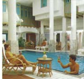
Hapimag Ferien-Residenz Bodrum/Türkei

geniessen Sie als wirtschaftlicher Mitbesitzer erstklassige Residenzen in Europa sowie in Übersee frei von Miete! Und schöpfen bei der Freizeitgestaltung aus dem Vollen.