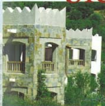
Hapimag Ferien-Residenz Bodrum/Türkei

meinten Sie, Ansprüche wie herrliche Lage, umfassendes Freizeitangebot, moderne Infrastruktur und spezielle Dienstleistungen seien unbezahlbar.