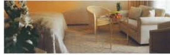
Die Junior-Suite mit jedem Komfort