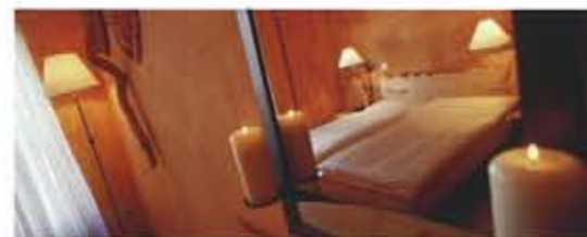
Entspannung in gepflegtem und romantischem Ambiente

Möchten Sie einmal in einem speziell designten Centurion Style Room übernachten? Oder lieber im Stil von «Under the Sun», «In den Alpen», «1001 Nacht» bzw. «Ocean und Beach»? Geniessen Sie im Hotel Misani unter dem Motto «I treat myself to luxury» ein Wochenende lang das