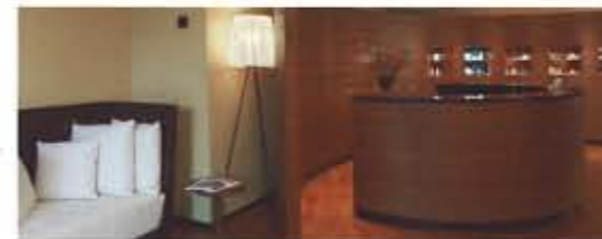
Willkommen zur Rundum-Entspannung

Rufen Sie kostenlos Ihren Centurion Travel Service an, wenn Sie sich informieren möchten – oder gleich reservieren! Tel. 00800 80 600 600