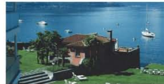
Ein kleines Paradies geniessen

Das exklusive Eden Roc am Lago Maggiore bietet seinen internationalen Gästen jenen prächtigen Stil und jene diskrete Noblesse, die man von einem Hotel der Spitzenklasse erwarten darf. Und mehr: Neben Yachthafen, Wellnessbereich mit drei Indoor/Outdoor-Schwimmbädern, 46 Luxus-zimmern und 36 Luxussuiten geniessen Sie hier auch kulinarische Highlights, die den Gaumen entzücken.