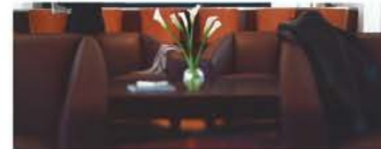
Ein herzliches «Willkommen» beginnt beim Check-in

für Wohlbefinden. Und für Erholung sorgt ein erstklassiger Service, der Ihnen Frühstück oder Dinner auch gerne auf Ihrer Privatterrasse kredenzt. Rund um die Uhr.