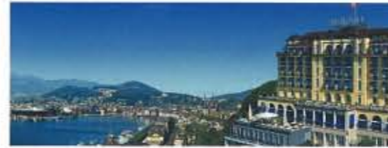
Schönheit, so weit das Auge reicht