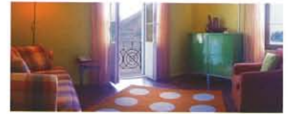
Das «Lemon & Lime»-Feeling erleben

Das moderne Art-déco-Hotel am Luganersee überrascht seine Gäste auf erfrischende Art mit Style Rooms, deren Themen sich in phantasievoll kombinierten Farbwelten reflektieren. Hier können Sie sich mitreissen lassen von der spielerischen Auseinandersetzung mit Trends, können die dramatische Farbinszenierung mediterraner Lebensfreude erleben und den urbanen Lifestyle gegen eine edle, aber betont legere Atmosphäre tauschen.